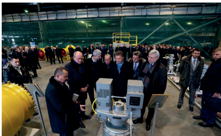
Томская область и Газпром были пионерами импортозамещения в России