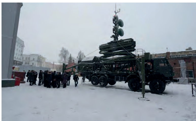
Томские инновационные компании работают и на оборонно-промышленный комплекс страны

«Иван-чай», таежный мед, натуральные соки, джемы и многое другое уже востребованы как в российских столицах, так и в странах Европы и Азии. И участники презентации Томской области в Торгово-промышленной палате, и посетители стенда области на проходившей в эти дни выставке «Продэкспо» это подтвердили: томскую продукцию ни с одной другой не спутать.